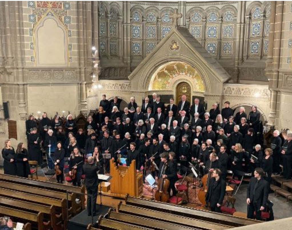
Die Kantorei bei der Aufführung zu C. H. Grauns Der Tod Jesu