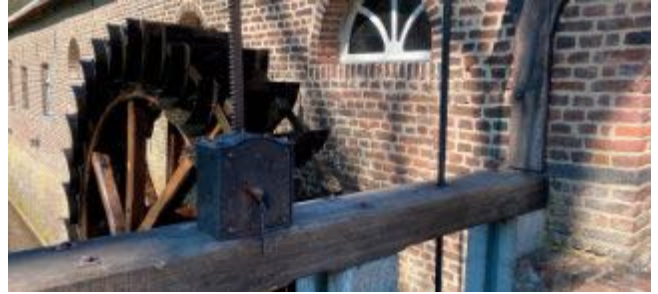
Die Wassermühle Gitstappermolen von 1377