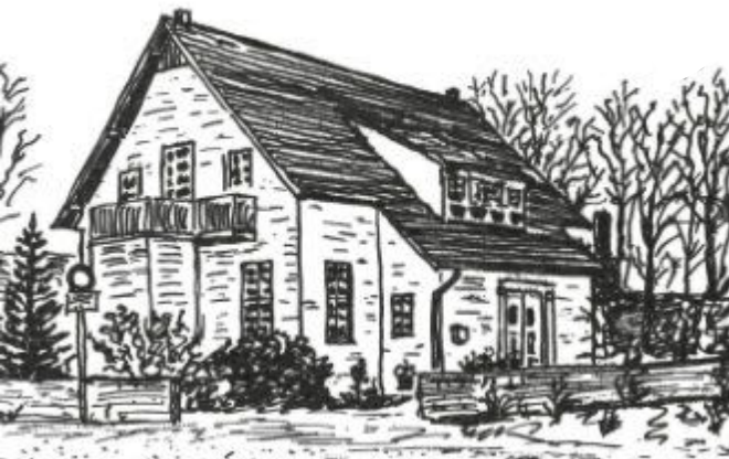
Zeichnung Olaf Nöller