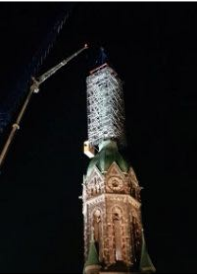
Die Turmspitze musste abgenommen und ...

Weitere Informationen und Beitrittserklärungen finden Sie auf unserer Homepage www.bauverein-hauptkirche-rheydt.de