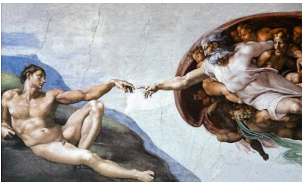
Gott erschafft Adam

Ausschnitt aus dem Deckengemälde in der Sixtinischen Kapelle