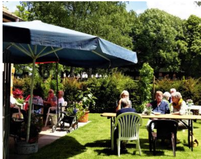
Das Café Eden– bei schönem Wetter auch gern im Freien