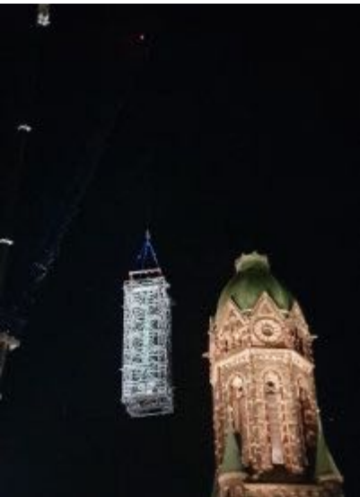
... neben dem Haupteingang zwischengelagert werden